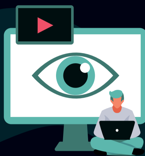
FIGURE DI PROGETTO: UX DESIGNER - SOFTWARE ARCHITECT - WEB CONTENT EDITOR